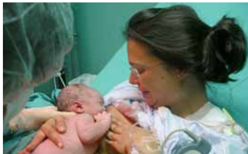
Després del part, contacte immediat

serà la que produirà la mare fins a la fi de la lactància i subministrarà al xiquet tots els nutrients necessaris i en les proporcions exactes. El teu fill continuarà rebent defenses i factors protectors i de creixement mentre prenga pit, defenses que el faran més resistent a infeccions i malalties cròniques, fins i tot en la seua vida adulta.